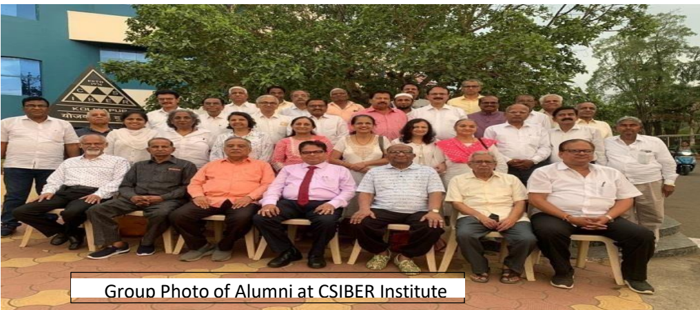
Group Photo of Alumni at CSIBER Institute